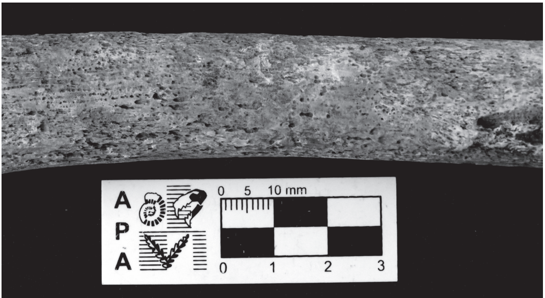
Fig. 7. Periostitis en diáfisis femoral.