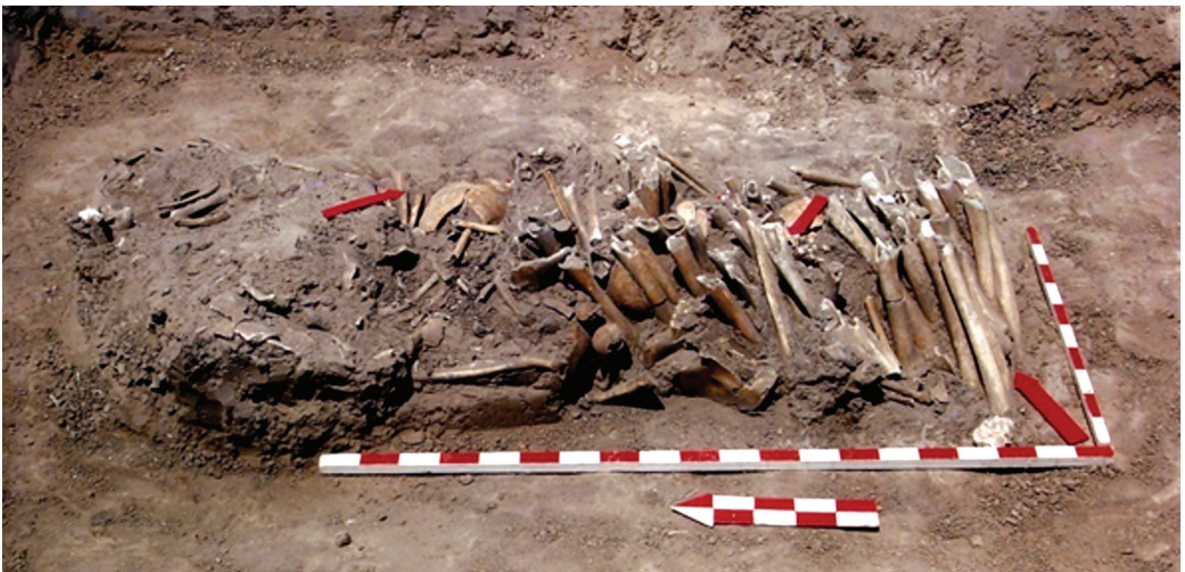
Fig. 2. Disposición de los restos en el espacio inhumatorio.

Para obtener el perfil demográfico de la muestra se procedió a la caracterización biológica de los individuos. En primer lugar, cada elemento óseo inventariado fue asignado a una categoría de edad (adulto o subadulto) en función de los criterios: tamaño de la pieza, grado de unión epífisis-diafisiaria (Scheuer y Black, 2000), cierre de sutura esfenoasilar (Galera, Ubelaker y Hayek, 1998) y erupción dentaria (Ubelaker, 1999). Dentro de la categoría subadulto, la estimación particularizada de la edad se realizó a partir de la longitud de los huesos largos (Scheuer y Black, 2000) y de la secuencia calcificación - erupción dentaria (Buikstra y Ubelaker, 1994; Moorrees, Fanning y Hunt, 1963). En el caso en que los huesos largos se encontraban fragmentados solo se tomaron mediciones como anchos de los extremos proximal y distal de húmero, radio, fémur y tibia como base para estimar una edad mínima (Cardoso, Vandergugten, y Humphrey, 2017; Hoppa y Gruspier, 1996). Los individuos identificados