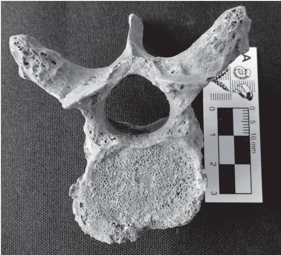
Fig. 6. Osteoarthritis vertebral.