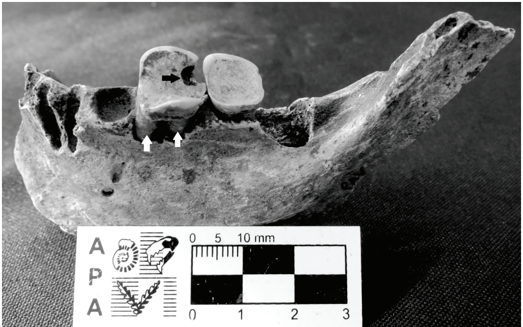
Fig. 5. Patologías afectando piezas dentarias el 1° molar inferior derecho en maxilar inferior. Caries (flecha negra), Periodontitis (flechas blancas).