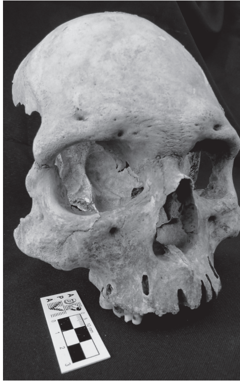
Fig. 4. Cráneo fragmentado perteneciente a un individuo de sexo masculino.