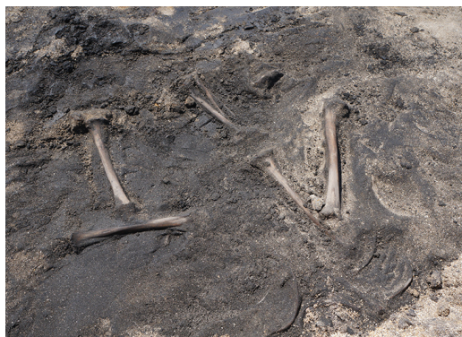
Fig. 7. Disposición flexionada.

giere que se trata de entierros primarios de individuos completos. La distribución y orientación de las unidades anatómicas observadas en el terreno y registradas fotográficamente sugieren además, un entierro primario con los miembros inferiores flexionados por lo menos en un individuo (Fig. 7).