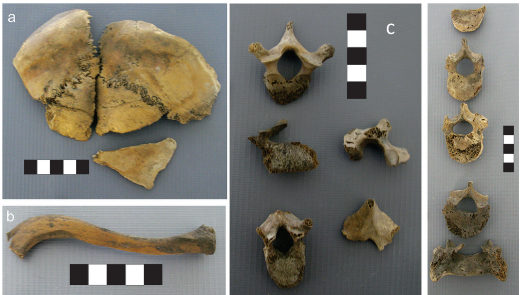
Fig 5. Restos sin individualizar. a) Fragmentos de cráneo. b) Clavícula. c) Vértabras.