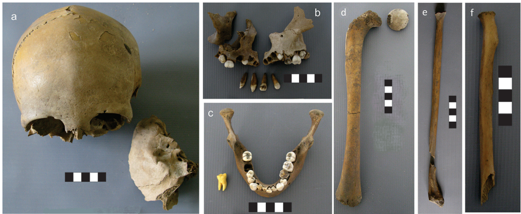
Fig. 3. Individuo 2. a) Cráneo. b) Maxilar. c) Mandíbula, a su izquierda la réplica dental del 1°MD. d) Fémur derecho. e) Peroné derecho. f) Radio derecho.

óseos, los cuales pudieron ser identificados: fragmentos de calcáneo y astrágalo (MCH 2-21), proceso coracoides de la escapula derecha (MC-4), 1 metacarpo (sin rótulo), 1 metacarpo (MC-2), 5° metacarpiano izquierdo (MC-1), 5° metacarpiano derecho (MCH2-21), navicular (MCH2-21), costillas: 1 izquierda, 2 derechas, 1 fragmento de costilla izquierda, 1 fragmento de costilla derecha (sin rótulo), 1 falsa derecha y 1 fragmento indet (MC-4), Vertebrae: 1°sacra; 2°, 3°, 4° y 5° lumbares; 2 torácicas, 3 fragmentos (sin rótulo); cervical (MC-2), 2 falanges de mano (MC-3), epífisis distal de tibia derecha (MCH2-21), clavícula derecha (MC-4), epífisis proximal peroné derecho (MCH2-21), 1° metatarso y 2 cuñas (MC-6); 3°, 4° y 5° metatarsianos derechos y fragmento indeterminado (MC-7); 3° y 5° metatarsianos izquierdos y 1 fragmento de calcáneo (MC-5), falange (superficie), 3 fragmentos de cráneo (sin rótulo) y 1 molar suelto (sin rótulo) (Fig. 5). Además se recuperaron 11 fragmentos que no pudieron ser identificados.