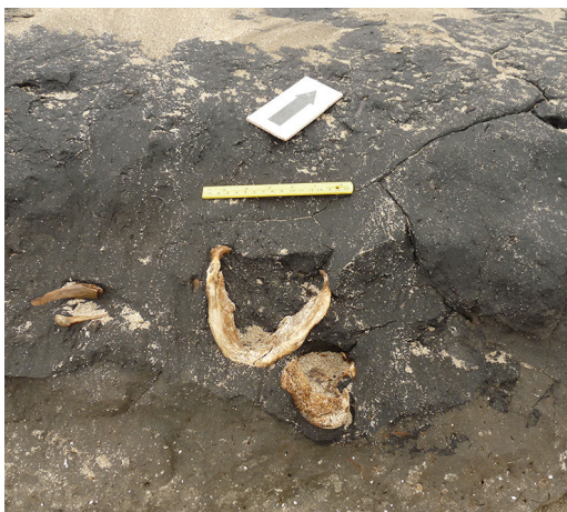
Fig. 6. Remoción por erosión marina.

Respecto a la preservación de los restos, y en relación a posibles procesos postdeposicionales, el lugar de hallazgo es de escasa circulación (aún cuando, estando prohibido, por ese sector pasan ocasionalmente vehículos 4x4), lo que favoreció que los especímenes se encontraran en buen estado de completitud, con un bajo nivel de fractura. Los restos no presentaban rastros de carbonatación, ni de óxidos de manganeso, así como tampoco signos de meteorización o blanqueamiento diferencial, características que