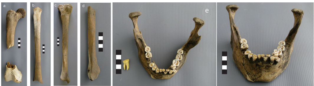
Fig. 2. Individuo 1. a) Fémur derecho. b) Fémur izquierdo. c) Tibia derecha. d) Peroné derecho. e) Mandíbula y réplica dental del 1° MD extraído para ADN.

Restos óseos humanos sin individualizar: Fueron recuperados en el sitio 42 elementos