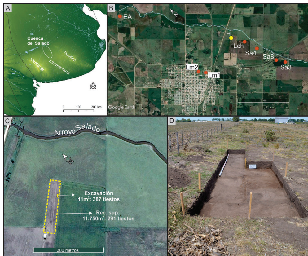
Figura 1. Área de estudio. A: Ubicación de la cuenca del arroyo Salado; B: Ubicación del sitio Hangar (H) y de otros sitios registrados en la cuenca media del arroyo Salado (EA: Escuela Agropecuaria, Lch: Loma Chismac, Sa3: Salado 3, Sa4: Salado 4, Sa8: Salado 8, Lm1: Laguna Muscar 1 y Lm2: Laguna Muscar 2); C: Detalle del área de muestreo de donde proviene la cerámica analizada en este trabajo; D: Planta de excavación del sitio Hangar (Cuadrículas 1 a 11)

En relación con los materiales del sitio, en el caso de los restos líticos, se registró un alto porcentaje y variedad de instrumentos, entre los cuales se destacan los raspadores y las puntas de proyectil. Se determinó la manufactura, reactivación y reciclado de puntas de proyectil, principalmente en fanita y ortocuarcita. El análisis de los sistemas de armas permitió identificar