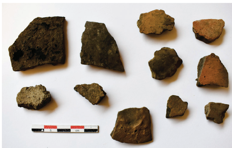
Figura 2. Ejemplares recuperados en el sitio Hangar con presencia de restos orgánicos carbonizados, superficies alisadas y erodadas

Se midió el ancho y largo máximo de 678 tiestos cerámicos, estimándose la superficie que representa cada uno. El fragmento más pequeño de la muestra corresponde a 0,05 cm 2 y el mayor a 47,29 cm 2 , en tanto que la media fue de 2,45 cm 2 (figura 2). El conjunto analizado se compone de 29 fragmentos correspondientes al sector del borde y 155 al cuerpo de las vasijas. Presentan una longitud máxima entre 20-40 mm (n=103) y ancho máximo ≤ a 25 mm (n=83). En relación con el NMV, se estimó la presencia de 10 piezas para el sitio.