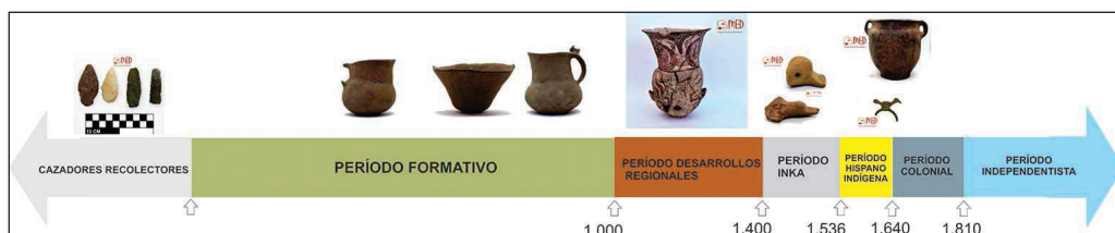
Figura 6. Infografía: línea de tiempo El Divisadero

Las secuencias y periodizaciones de la disciplina arqueológica y la empleada para el Noroeste argentino son diferentes a las líneas de tiempo empleadas por los docentes de educación primaria y secundaria en su representación gráfica. Así, realizamos una adaptación horizontal de la periodización e incluimos los Períodos Colonial e Independentista (figura 6).