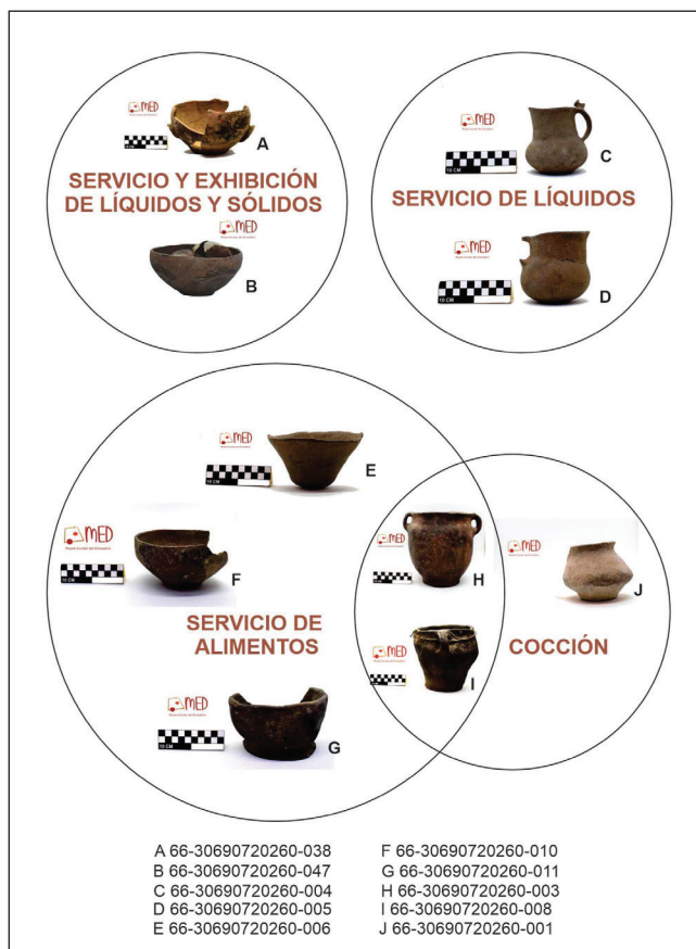
Figura 4. Colección arqueológica escuela San Agustín. Vasijas agrupadas según función estimada

Como el sitio se destaca por el arte rupestre, los docentes solicitaron la interpretación y significado de las pinturas, sobre todo de la denominada Cueva del Suri. En uno de los talleres relatamos sobre la investigación arqueológica de esta evidencia, los resultados obtenidos y las estrategias empleadas para su análisis, específicamente de las dificultades para efectuar una explicación literal del significado. La línea interpretativa de nuestro proyecto, tanto para el arte como para todas las evidencias, estuvo enfocada en explicar la funcionalidad del sitio, tanto de actividades rituales como domésticas (Bradley 2005; Brey 2012; Ledesma et al. 2019). También presentamos una síntesis de las evidencias rupestres en el Noroeste argentino y las clasificaciones de los temas y motivos rupestres (Aschero 2000).