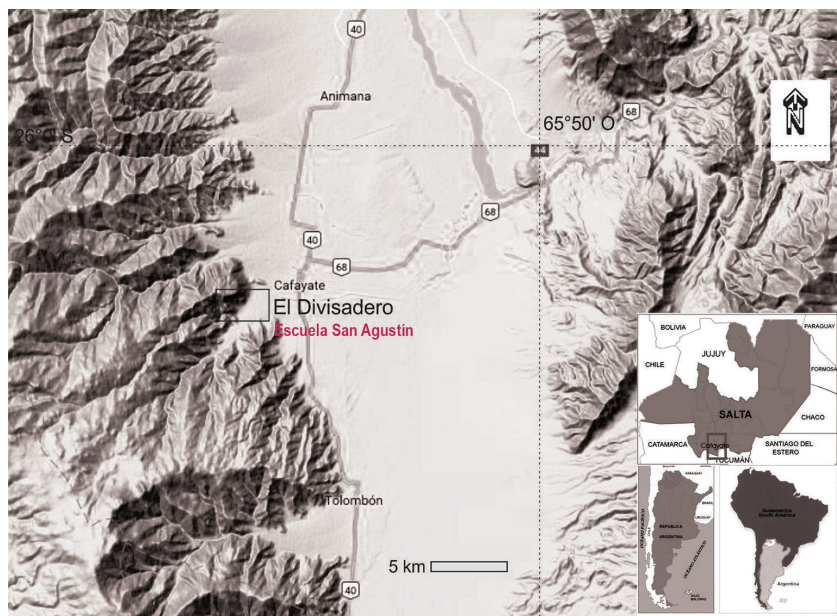
Figura 3. Ubicación Sitio arqueológico El Divisadero y escuela San Agustín

Respecto a los temas de mayor demanda, como los vinculados a las tecnologías prehispánicas en El Divisadero contábamos con problemáticas puntuales desarrolladas por integrantes de nuestro proyecto como arte rupestre, agricultura, producción de alimentos y cerámica. Pero también otros temas fueron puestos en reserva por falta de evidencia material o contextual, como por ejemplo la tecnología de cabezales líticos, metalurgia y el uso de alucinógenos. Y un tema no menor vinculado a la temporalidad, es decir, qué antigüedad tiene el sitio arqueológico.