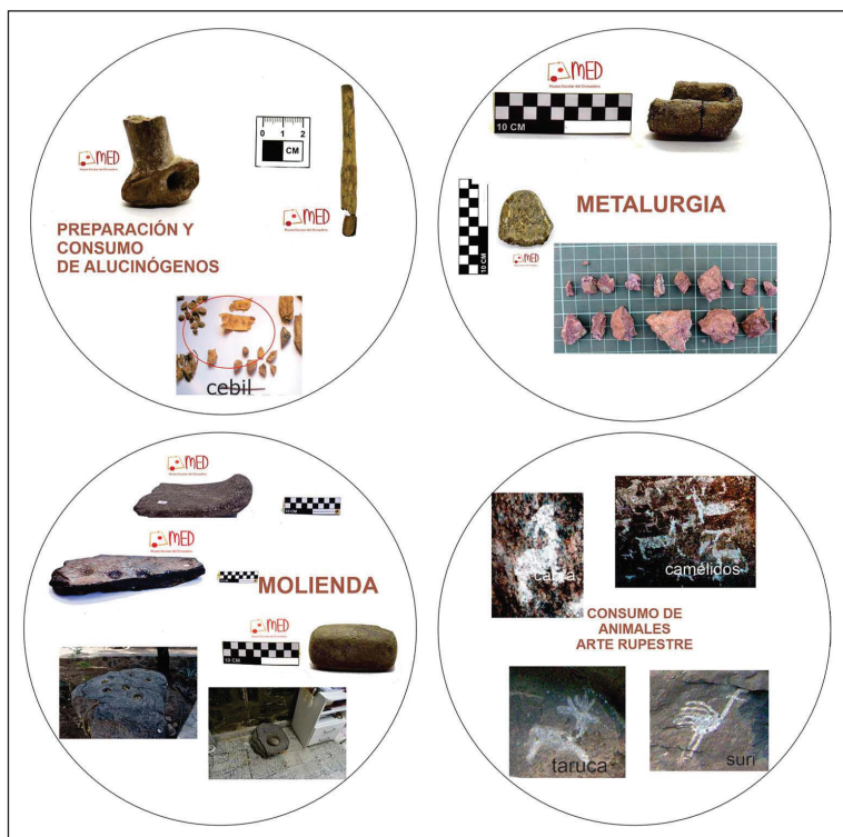
Figura 5. Talleres docentes: infografías sobre molienda, metalurgia, consumo de alucinógenos, preparación y consumo de alimentos

De esta manera, la evidencia sobre metalurgia y consumo de alucinógenos es parcial, pero son nuevas líneas para profundizar en el diseño de futuros trabajos (figura 5).