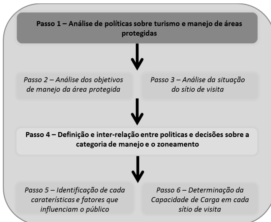
Figura 2. Processo de Planejamento para manejo de Visitação em Unidades de Conservação. Adaptado de Cifuentes (1992).

Capacidade de Carga Real (CCR): é o limite máximo de visitas, determinado a partir da CCF de um lugar, após submetê-lo aos fatores de correção definidos em função das características particulares do lugar. Os fatores de correção são obtidos considerando variáveis físicas, ambientais, ecológicas, sociais e de manejo. Podendo ser expressa pela fórmula geral: